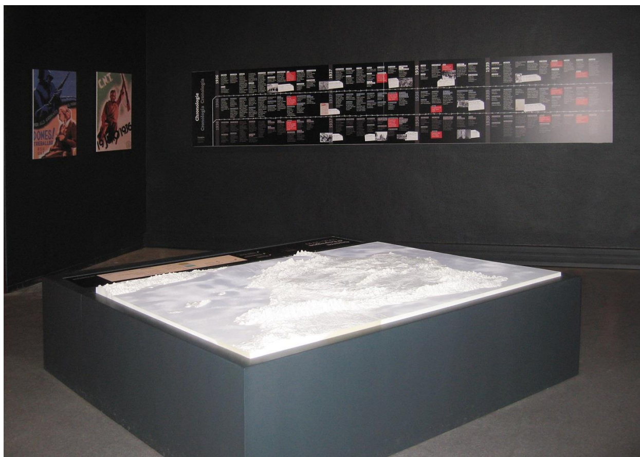
Figure 1: Carte interactive et chronologie dans la séquence 1 de l'exposition (V. Soulier, 2015)

En deuxième lieu, le dispositif de transmission du savoir s'appuie sur des matériaux qui ont présidé à l'élaboration du discours historique. À titre d'aide à l'interprétation en contexte expositionnel, les articles de presse faisaient partie au préalable des corpus de recherche. De plus, la construction des dispositifs expositionnels s'appuie sur les outils de diffusion traditionnellement employés par les historiens et les didacticiens de l'histoire: la carte historique et la chronologie (figure 1). Les visiteurs doivent être familiers avec ce champ de connaissances pour être à même de s'appropriier les informations ainsi médiatisées de manière autonome.