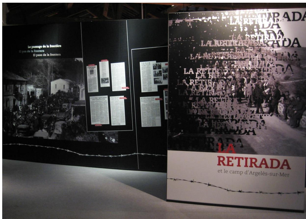
Figure 2: Exemples de photographies et d'articles de presse exposés (V. Soulier, 2015)

effet de dramatisation. Le visiteur est ainsi plongé dans la souffrance et la lutte en tant que témoin.