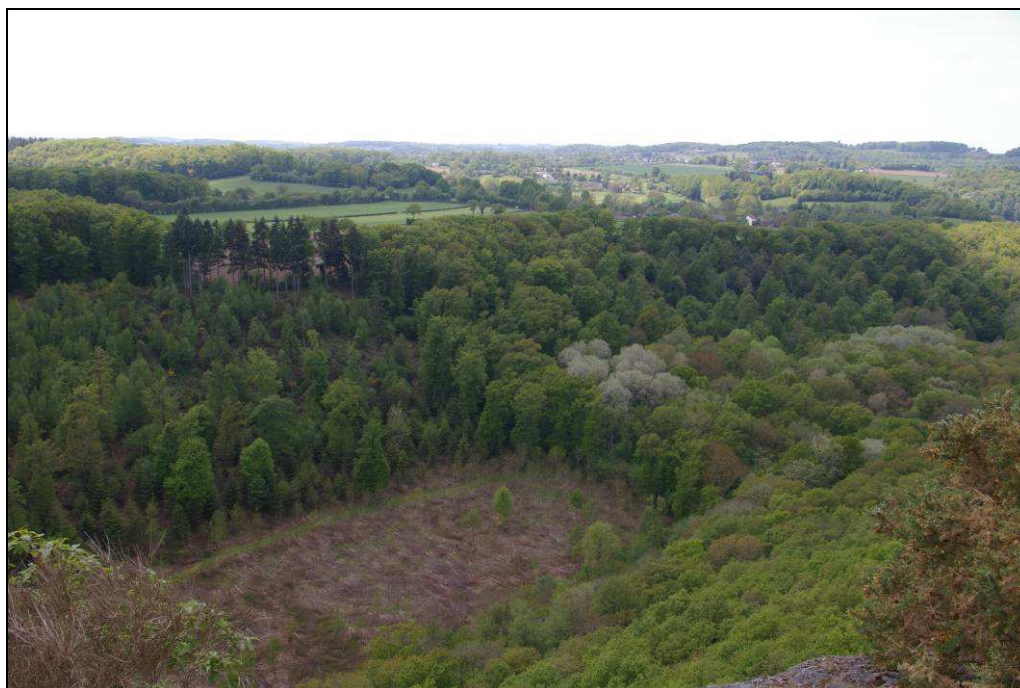
Point de vue du site aménagé des Roches d'Oëtre, Suisse normande

La dernière étape de l'excursion s'est arrêtée aux Roches d'Oëtre dans la Suisse normande dont le pittoresque de la topographie est dû au soulèvement du massif ancien à l'ère tertiaire et au creusement des vallées en gorge. La dissymétrie des versants favorise les variantes paysagères, comme ici depuis le point de vue du site aménagé à des fins touristiques. Les versants les plus abrupts et les plus escarpés, autrefois couverts par la lande, sont aujourd'hui forestiers, tandis que les replats et les versants doux portent un bocage en partie transformé par le remembrement parcellaire et l'évolution du système de cultures (céréales et cultures fourragères).