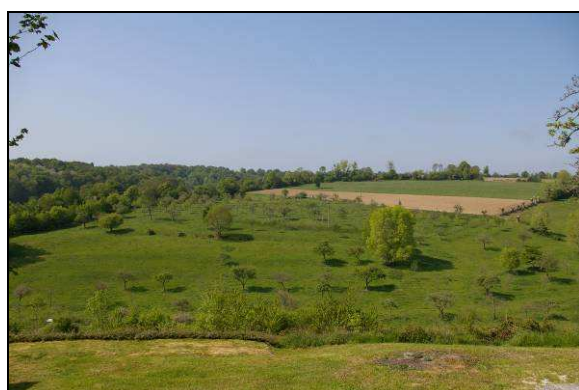
Labours, prairies et prés-vergers