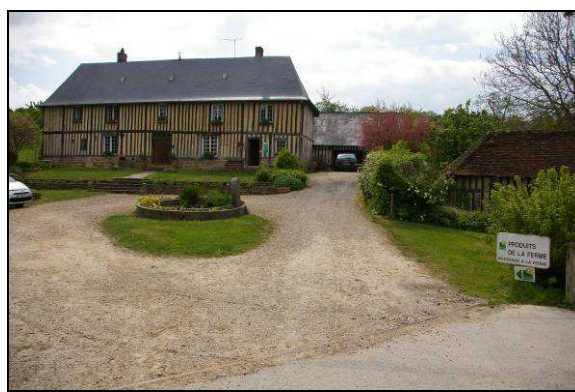
Gîtes et accueil agritouristique