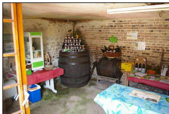
Point de vente directe