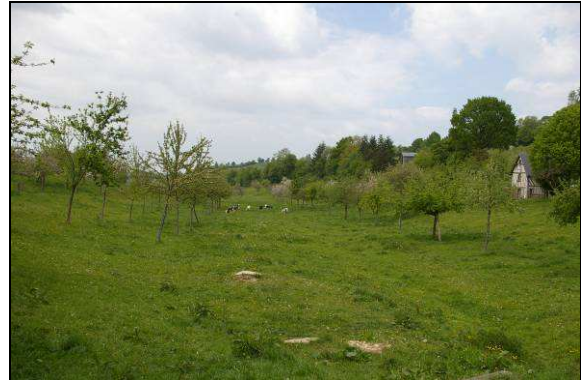
Pré-verger du terroir cidricole