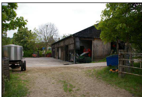
Bâtiments de transformation