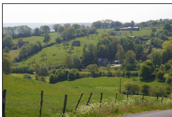
Prairies et haies bocagères