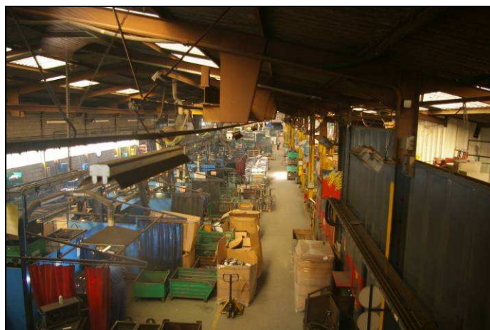
Atelier d'usinage et d'assemblage de l'entreprise ABL à Vassy

La région est aussi le berceau de la quincaillerie normande, une industrie rurale qui s'était organisée en système productif localisé dans le canton de Tinchebray (Groupement des fabricants de quincaillerie normand). La visite concerne cependant une entreprise en marge de ce système, l'entreprise ABL de Vassy, qui a quitté le groupement il y a une quinzaine d'années à la suite de sa restructuration mais aussi pour bénéficier d'une opportunité foncière d'installation sur la communauté de communes de Vassy. L'entreprise emploie 35 salariés qui pour la plupart ont suivi la délocalisation depuis Tinchebray. Elle est spécialisée dans la production d'outils soudés. L'usinage et l'assemblage se font sur des chaînes semi-automatisées. Le travail est posté, segmenté et spécialisé (presse, soudure, peinture, etc...). L'atelier s'approvisionne en bobines d'acier refondu, principalement en Italie et en Belgique. Il dispose d'un stock de 1 à 2 mois et écoule sa production auprès des centrales d'achat et des quincailleries indépendantes. L'équilibre de l'activité procède à la fois de la minimisation de l'investissement dans les machines-outils, de la maintenance du matériel en interne, de la compression des coûts de personnels (formation sur le tas) et de la localisation de proximité qui permet d'affronter la concurrence étrangère et les produits d'importation soumis à des délais d'acheminement et d'approvisionnement plus longs.