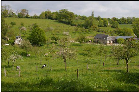
Pré-verger du terroir cidricole