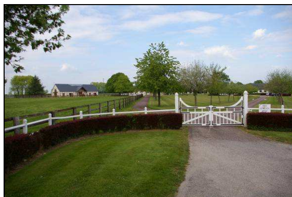
Vue sur les prés enclos (« paddock »)