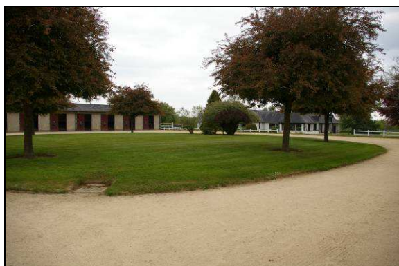
Vue sur les boxes